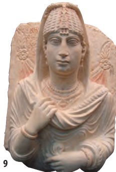
9. Gravbyst av kalksten, Palmyra, 200-talet e.v.t., 60 x 45 cm.

Elfenbensreliefer: Plattor dekorerade med människofigurer, djur, växter eller geometriska motiv, ibland perforerade. Vissa avbildar en "kvinna vid fönstret". Ungefärliga mått: 10 x 10 cm. [11]