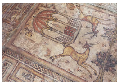
19. Mosaik av kalkstenskuber föreställande en helgedom med djur- och växtmotiv (en hel scen och en detalj), At Tamani'ah, andra hälften av 400-talet e.v.t., totalmått 85 x 85 cm, enskilda kuber 0,8–1 cm.

Mosaiker: Från golv och väggar. Sten-, keramik- och glaskuber; föreställande människor, byggnader, landskap. [19]