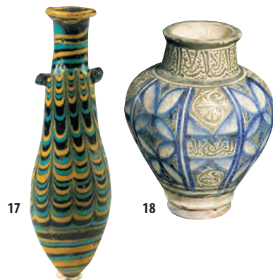
18. Glaserad polykrom keramikvas, Mamlukperioden (1249–1323 e.v.t.), 33,5 x Ø 26,5 cm.