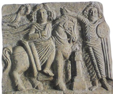
10. Lågreliëf av gips som föreställår "Asadu och Sada", Dura-Europos, 1–199 e.v.t., 46 x 46 x 8 cm.