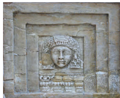
11. Platta av elfvenben som föreställår en "kvinna vid fönstret", Arslan Tash, järnålder (700-talet f.v.t.), 8 x 9,7 x 1,2 cm.