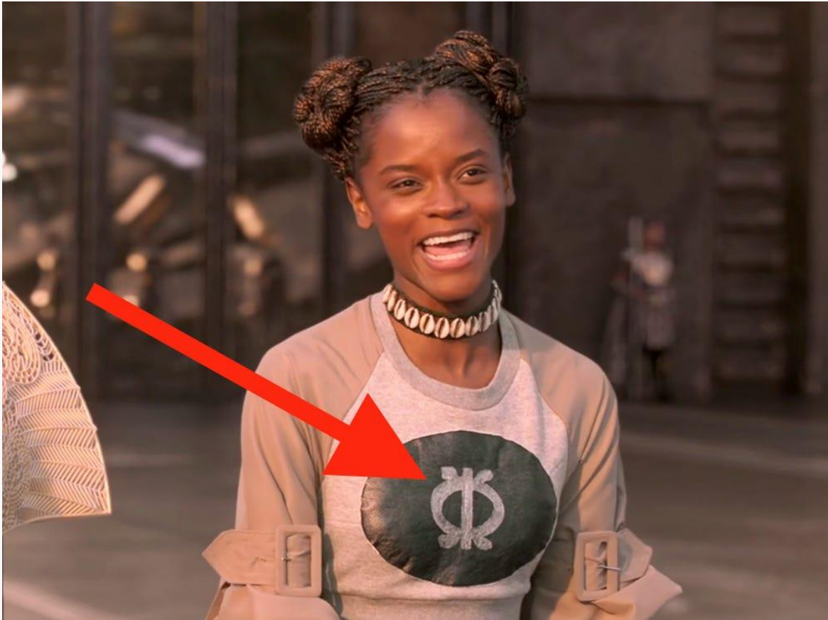
Letitia Wright spelar Shuri.

I en ny del av Vanity Fairs "Notes on a Scene" förklarade Carter de olika designelementen i Shuris kostymer . Dräkten shuri bär har en Adinkra-symbol (kulturella visuella symboler från Asante / Ghana-regionen i Afrika) på den. "Denna Adinkra-symbol betyder 'syfte'," sa Carter. "Och hon har verkligen ett syfte i Wakanda."